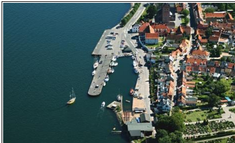
Alter Hafen von Middelfart