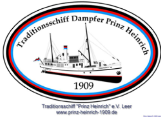
„Traditionschiff PRINZ HEINRICH, 1909“ (Erhalt eines Dampfschiffes)