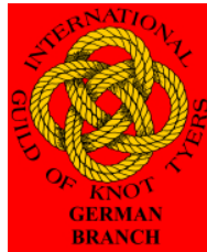
„International Guild of Knot Tyers“ (Gilde der Knotenmacher)