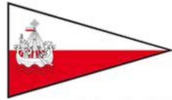
„Museumshafen Lübeck e.V.“ (Traditionschiffe in Lübeck)