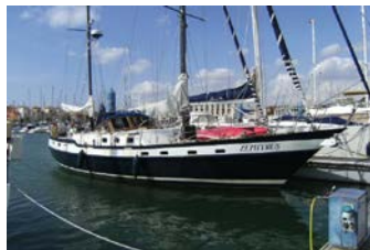
„suncoast project“ (Restaurierung einer Ketsch)