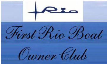
„Rio Boat Club“ (Klassische „Rio“-Motorboote)

Nachfolgend einige Links zu Personen, Organisationen und anderen, mit denen uns ein gleiches Ziel verbindet: der Erhalt des maritimen Kulturgutes in unserem Lande.