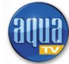
„Aqua TV“ (Internet-Wassersportmagazin)