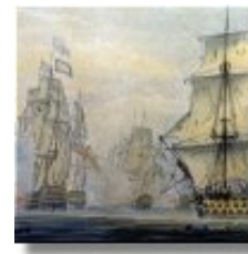
„Line of Battle“ (Seekrieg gegen Napoleon)