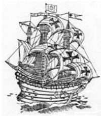
„TimeDesign“ (DIE Liste für Schiffsnachbauten)