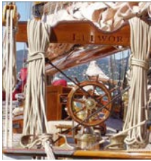
„Gerhard Standop“ (Architekt und Photograph)