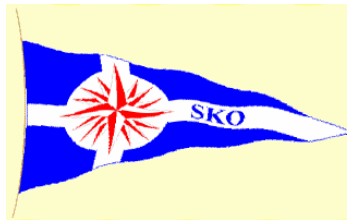
„Segelkameradschaft Ostsee e.V.“ (Erhalt des 12ers ANITA)