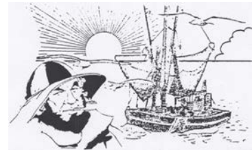
Sassnitzer und Rostocker Hochseefischerei der ehem. DDR

Bitte nachfolgende WebSites als WebLinks einbauen: