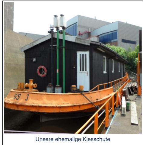
Unsere ehemalige Kiesschute

Da der Voreigentümer den Platz brauchte, wurde das Hausboot von Hamburg über die Kanäle bis Genthin geschleppt. Einen eigenen Antrieb hat es nicht. Der Transport wird angemeldet und vom dortigen WSA (Wasser- und Schiffsamt) eine Schiffsuntersuchung incl. Bodengutachten angeordnet. Weiterhin eine Schleppnase für den Transport. Alle Werte positiv - und erste Kosten.