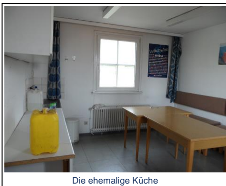
Die ehemalige Küche

Nun liegen wir in einer „Schimasky“-Kulisse. Aber Duisburg ist schon mal nah bei Düsseldorf. Und so können wir mit den ersten Arbeiten beginnen. Das Boot liegt abseits, also keine direkte Anlieferung möglich.