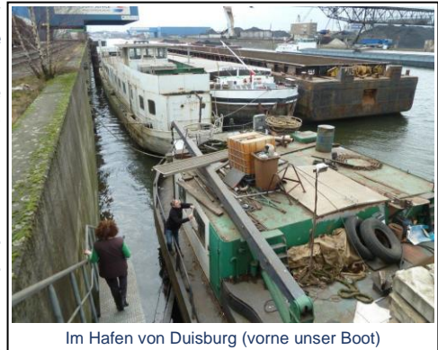
Im Hafen von Duisburg (vorne unser Boot)

Im Februar 2013 sollten wir nun endlich nach Hitdorf. Nun haben wir gerade Hochwasser. O.K., normales Wasser scheint es ja auch nicht zu geben. Da der Schlepper ausschliesslich uns schleppt - teure 80 km. Noch einmal flugs ein verlangtes Sonder-Transportgutachten und bei minus 18°C. geht es nach Hitdorf. Wie ich mich freute! Der Empfang unseres Liegeplatzvermieters - frostig. „Das Boot ist zu gross. Hier können Sie nicht lange bleiben“. Ja, wie gross hatte er sich denn avisierte 27,60 m vorgestellt? Wie gut, dass ich längst meinen eigenen Liegeplatz beantragt hatte. Hitdorf ist so ein schöner Naturhafen.